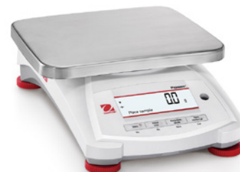
Modello PX12001 e PX12001/E

Quattro tasti rapidi consentono un facile funzionamento con più modalità di pesata.